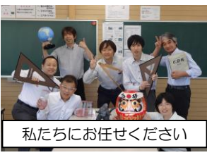
私たちにお任せください

講師陣は全員が専任。子どもたちの学力向上、志望校合格のため日々自己研鑽に励み、變わりゆく文科省の教育方針、入試制度に対応しながら、中学入試から大学入試まで一人ひとりの進路に応じた指導をしています。