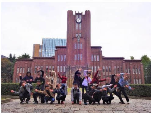
大学見学ツアー (東大安田講堂前)