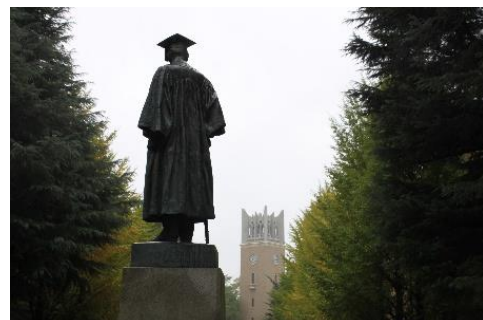
早稲田大学 (大隈重信像)